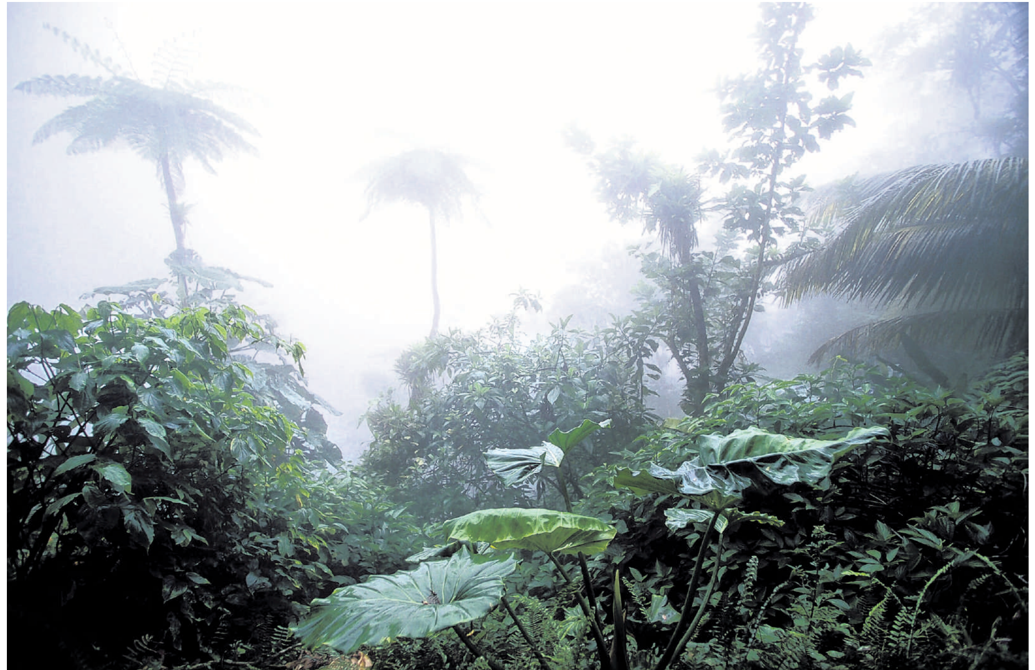
In de oerwouden van Saba blaast de wind wolken door de vegetatie, waardoor een uniek 'nevelbos' ontstaat.

www.trouw.nl/groen Voor eerdere afleveringen en vragen over inheemse natuur